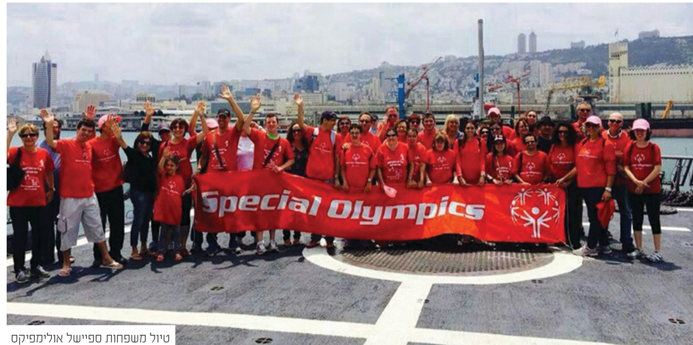
טיול משפחות ספיישל אולימפיקס

לשאלות: 07-7200 10000 | "מחיל" סניף ארבע לביד קניון סמל סניף בעיר בחינם | מוציאה כניסית על 4 נוסעים. טל 05-6424242 במסלול: מסעדת הבשרים שופרס | מוזיאון תל אביב | מוזיאון תל אביב | מוזיאון תל אביב | מוזיאון תל אביב