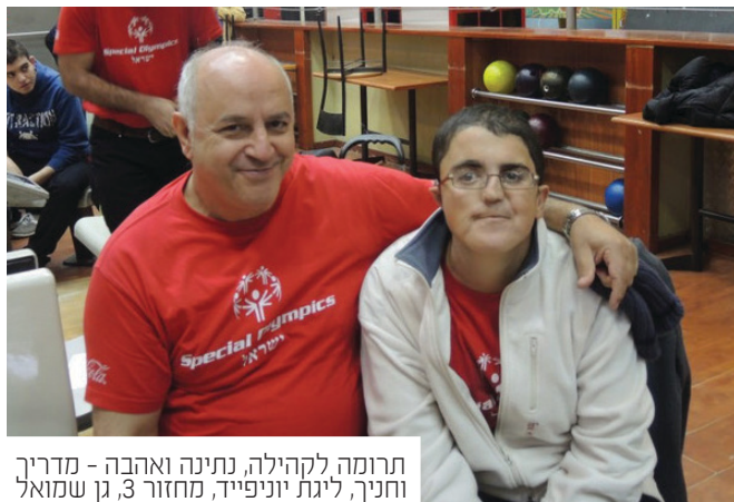
תרומה לקהילה, נתינה ואהבה - מדריך וחניך, ליגת יוניפייד, מחזור 3, גן שמואל