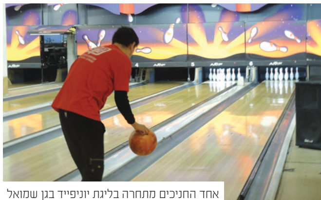
אחד החניכים מתחרה בליגת יוניפייד בגן שמואל